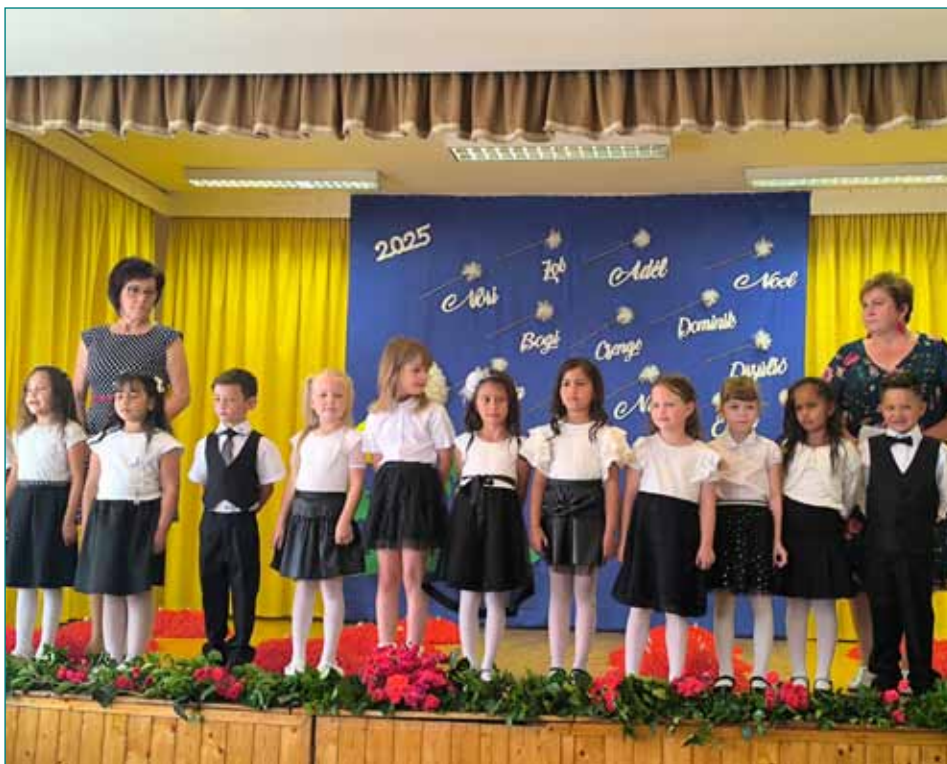
Az óvodától búcsúzó nagycsoportosok