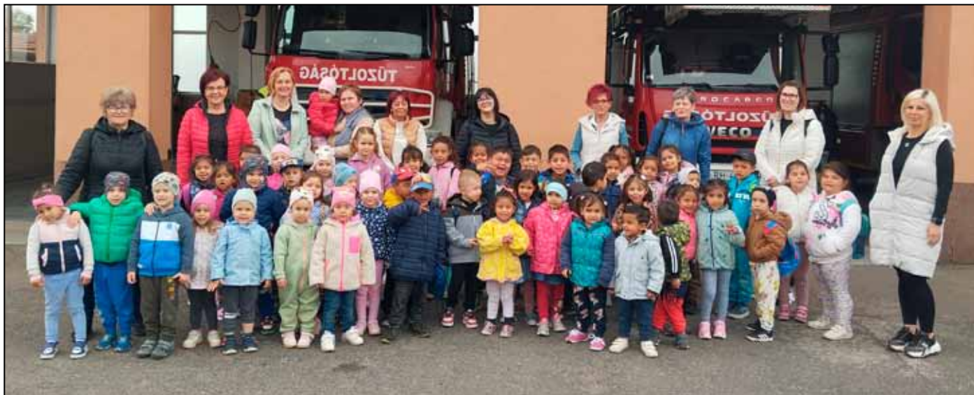
Kirándulás a Tűzoltóságnál