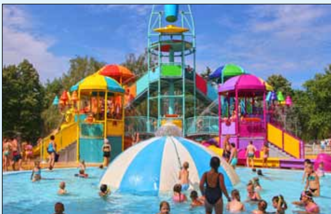
Nagyon sok gyermek kedveli már most a Pancsoló Paradicsomot