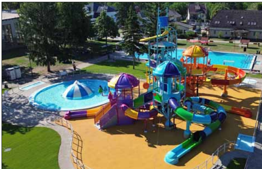
A Pancsoló Paradicsom új arculatot adott a bogácsi fürdőnek

A fizikai fejlesztések mellett a digitális infrastruktúra is korszerűsödött. Korszerű Wifi