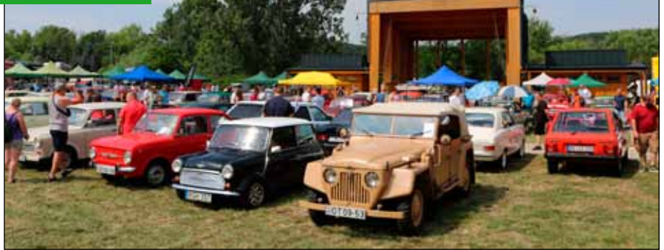
A járműcsodák sok látogatót vonzottak

A nap során volt közönségzavazás, ahol keresték a legszebb autókat, motorokat