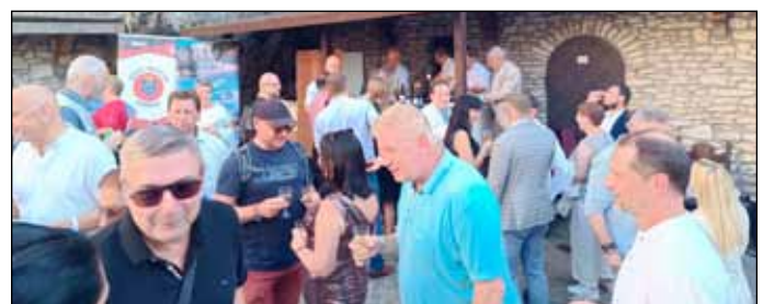
Csáter apó bora közelebb hozta Ogradzieniecben is a lengyeleket és a magyarokat