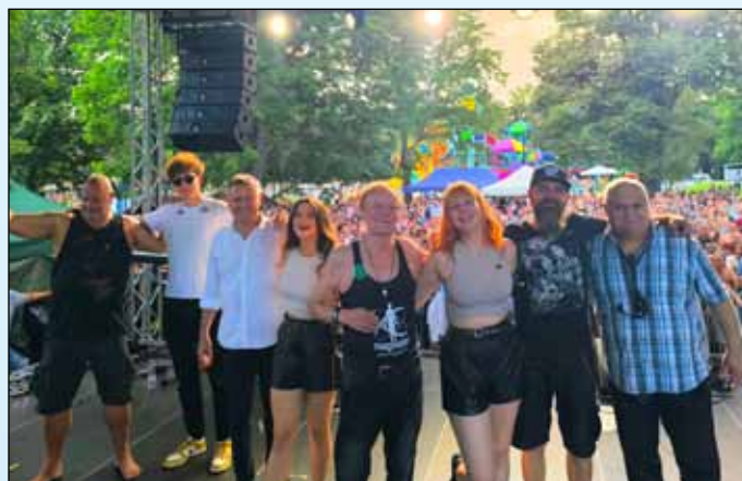
A Bikini együttes jó zenéjével buli hangulatot teremtett a fürdőben