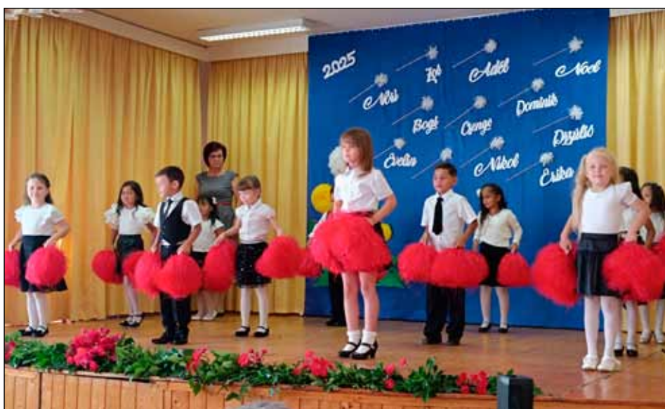
A nagy és középső csoportosok bájos műsorral örvendeztették meg szüleiket