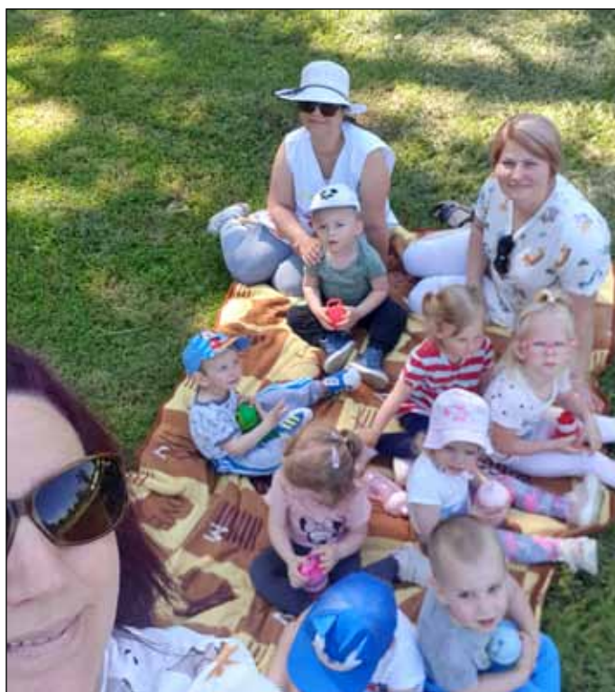
Piknik a bölcsődésekkel