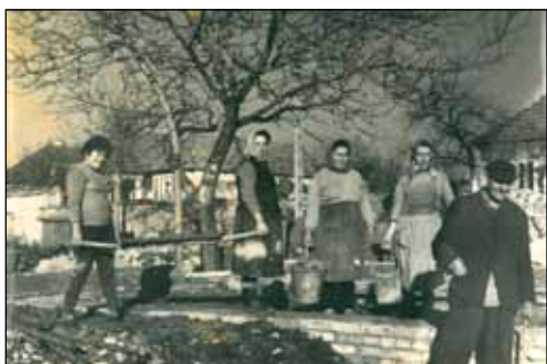
Az Orvosi Rendelő felépítéséért az asszonyok kemény fizikai munkákra is vállalkoztak

Egyre többen jártak el a közeli városok üzemeibe dolgozni, s az 1970-es évektől községünkben a természeti kincsekre (termálvíz, tiszta levegő, a falu kedvező földrajzi fekvése) és az emberi leleményességre alapozva új gazdasági ágazat jött létre, a könnyebb