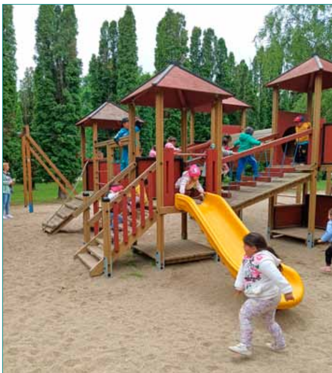
A mezőkövesdi játszóteret örömmel vették birtokba a bogácsi gyerekek

A nap végére mindenki kellemesen elfáradt, de boldog mosollyal tértek vissza az intézménybe. A gyermeknap így igazán emlékezetessé vált, tele felfedezéssel, játékkal és örömteli pillanatokkal.