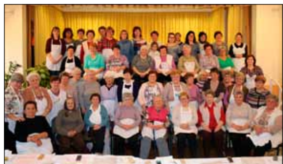
2019-ben ilyen sokan voltunk a csigacsináláson