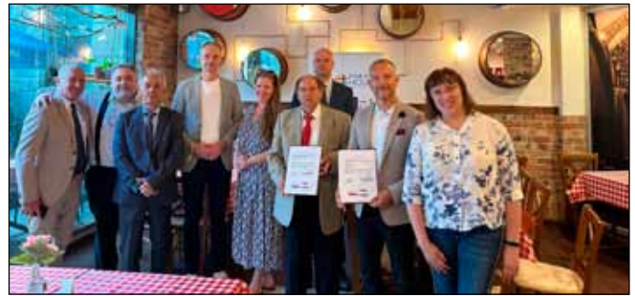
Tichy város vezetőivel az együttműködési szerződés megkötése után

Az Europa Haus Alapítvány és a Bogácsi Szent Márton Borrend meggyőződéssel vallja, hogy az aláírt nyilatkozat tartós, és gyümölcsöző együttműködés kezdetét jelenti, hozzájárulva a lengyel-magyar barátság erősítéséhez.