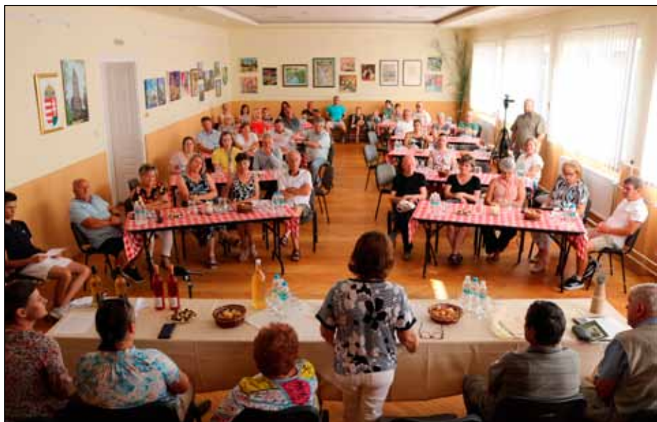
Az „Egy korty Bogács” esten elhangzott versek műsója a bogácsi bor volt