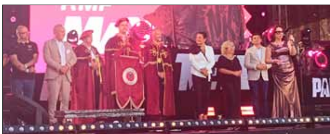
A bogácsi delegáció néhány tagja az Ogradzieniec „Város napja” hivatalos megnyitóján