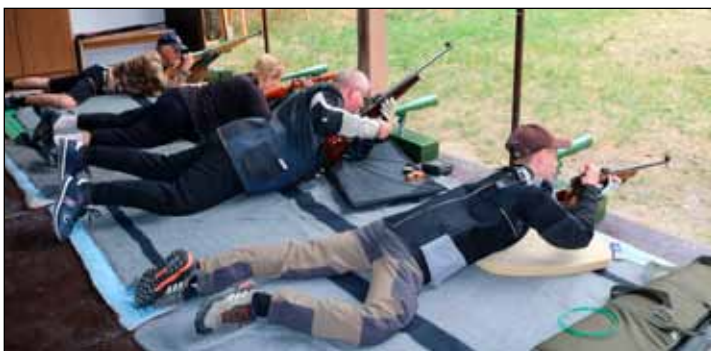
Tölts, Célozz, Tüzelj!