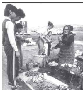
A bogácsi termelők jószívvel ajánlották portékáikat a turistáknak