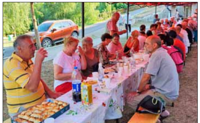
A vidám társaság a jóízű falatozás után jóízű beszélgetésbe, majd jóízű nótázásba kezdett