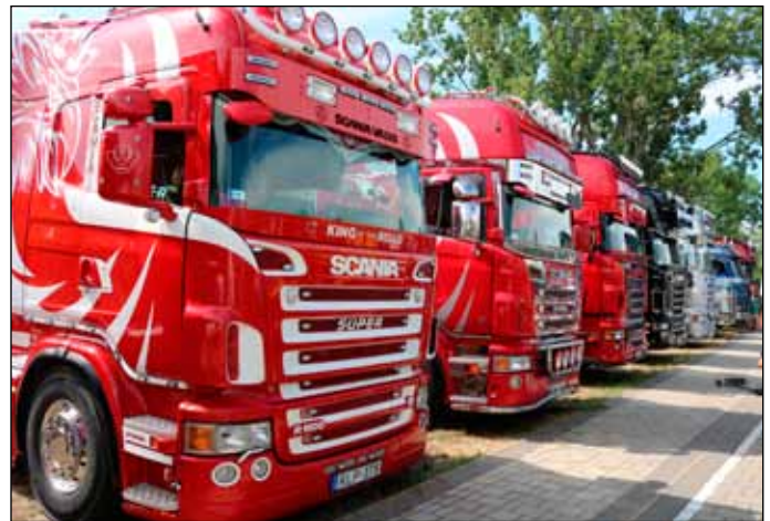
Szebbnél szebb kamionokat láthattunk a Rendezvényparkban