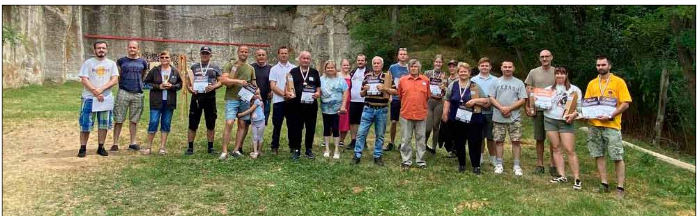
A 2025. június 28-ai bogácsi lövészverseny résztvevői