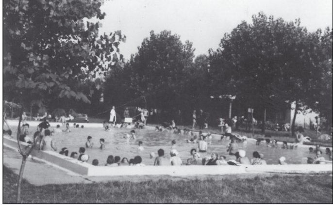
A bogácsi fürdő 1972-ben

Bogácson évszázadokon keresztül fával fűtöttek, sokan hordtak haza rőzsét a falut körülölelő erdőkből, ezzel fűtötték a kemencét, később a masinát (sparhelt), amin a mindennapos főzés, vízmelegítés céljából mindig találhattunk egy-két nagyobb fazekat. A szilárd tüzelésű kályhákat a '80-as évektől folyamatosan váltotta fel a villamos fűtésű hőtárolós, az olaj-, majd a gázvezetékek kiépítése után a gázfűtés. Napjainkra az olajfűtés teljesen megszűnt, a fa- és a gáz mellett viszont nagy teret hódít a kényelmes hűtésre-fűtésre optimalizált klíma.