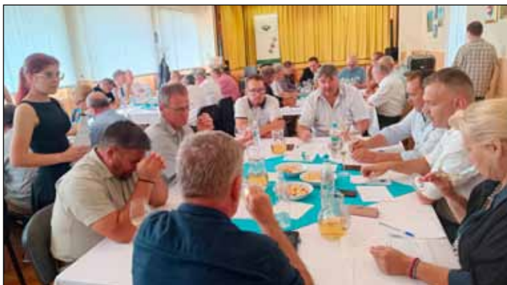
A neves borbírák jó minőségű borokat kóstolhattak a XXXI. Bükkaljai Borversenyen