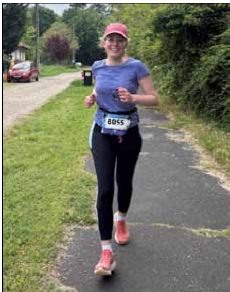
Diána sportszerűen fut, itt éppen az Ultrablaton futóversenyen

Azóta sok minden történt velem. Miskolcon a Fényi Gyula Jezsuita Gimnáziumban érettségiztem. Itt laktam először kollégiumban és itt szembesültem először első kézből azzal is, milyen menő bogácsinak lenni. Hiszen míg a kollégista társaim nyaralni jártak ide, addig irigylkedve hallgatták, hogy én minden hétvégén Bogácsra megyek haza. A gimnáziumi évek alatt lehetőségem nyílt külföldön is tanulni, eljutottam Pekingbe a gimnázium jóvoltából és az Egyesült Államokba, St. Louisban is tanulhattam. Az itt töltött idő erősített meg abban, hogy az orvosi egyetemre felvételizek. Az érettségi után felvételt nyertem a Semelweis Egyetemre. Isten segítségével és sok munkával elvégeztem az ország egyik legszínvonalasabb egyetemét, orvos lettem. Renge-