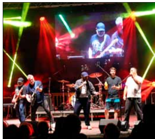
Crazy Little Queen együttes a hihetetlenül gazdag Queen életmű világlágereit hozta el a Rendezvényparkba