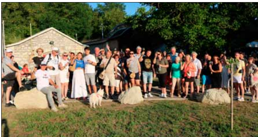
A június végi vidám bortúra résztvevői