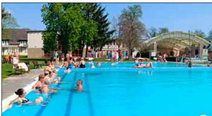
Fürdőnk a fejlesztések alatt is várja a vendégeket

Ami a vendégforgalmat illeti, fontos különbséget tenni a fürdő látogatottsága és a szálláshelyeink kihasználtsága között. Örömmel mondhatjuk, hogy fürdőnk látogatottsága a jelentős, pályázati forrásból megvalósuló munkálatok ellenére is hasonló az előző év azonos időszakához képest.