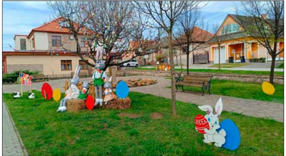
Faluszépítés – Húsvéti hangulat a Fialatok terén