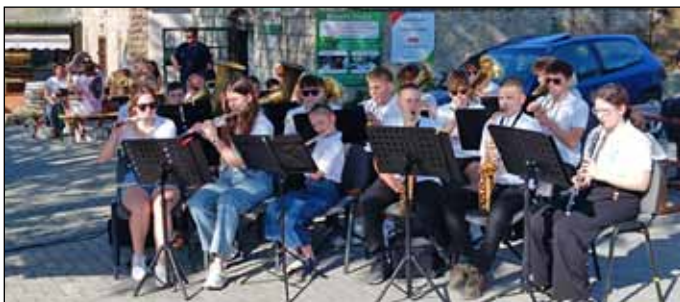
A Hórvölgye Alapfokú Művészeti Iskola fúvószenekara által jól ismert dallamok csendültek fel