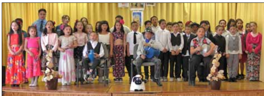
A roma kultúra napján színvonalas műsorokkal álltak színpadra a gyerekek