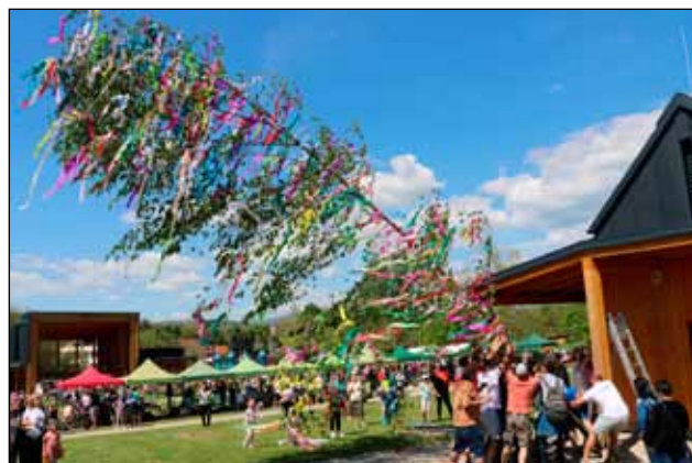
A község májuszáját jól látható helyre állították a legények