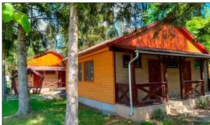
A fürdőnk üzemeltetésébe került faházakkal is bővül szálláskínálatunk