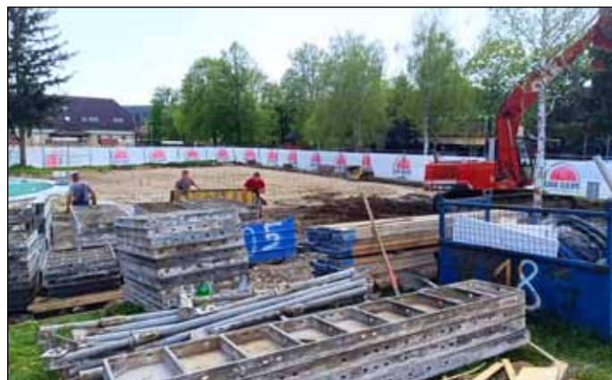
Nagy erővel folyik a vízi vár építése