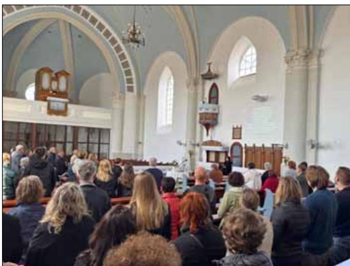
Istentisztelet a Cserépfalui Református Templomban