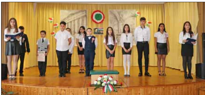
Iskolánk tanulói méltó módon emlékeztek meg 1848. március 15-ről