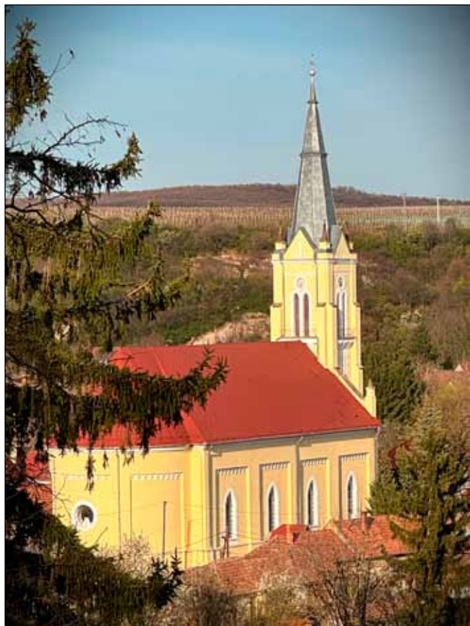
Istennek háza Cserépfaluban