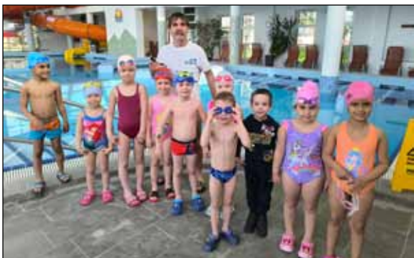
Az óvodai úszásoktatás célja, hogy a gyermekek megbarátkozzanak a víz közegével, megtanuljanak siklani, merülni, lebegni