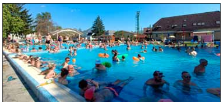
Az ikermedence közkedvelté vált 2025-re