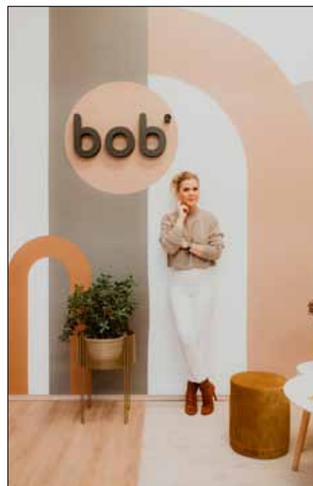
Dóri a vállalkozása kapcsán már hozzászólt a riportokhoz, fotózásokhoz

Mai napig rengeteg munkaóra, tanulópénz és önfeláldozás van ebben a vállalkozásban, de mondhatni, minden nap úgy kelek fel, hogy teltre kész vagyok és imádom a munkám. Könnyebben elfáradok mint a kezdetekkor, hisz 8 év telt el, de a vásárlói visszajelzések, a sok kedvesség, amit kapok, nagyon sokat ad vissza nekem.