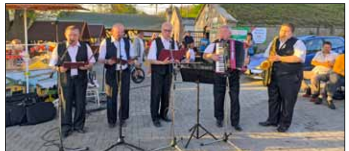
A kiváló lengyel zenészek fantasztikus hangulatot teremtettek a Cserépi úti pincesoron