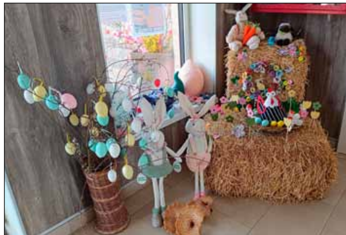
A húsvéti dekorációval ünnepi hangulatot teremtettek a dolgozók a fürdő előterében

A fizikai megújulás mellett a digitális térben is fontos lépést tettünk: teljesen új weboldalt hoztunk létre (bogacsigyogyfurdo.hu). A korábbi portálrendszer elavultsága miatt elkerülhetetlenné vált a csere, de nemcsak a technikai háttér frissült. Az új honlap mo-