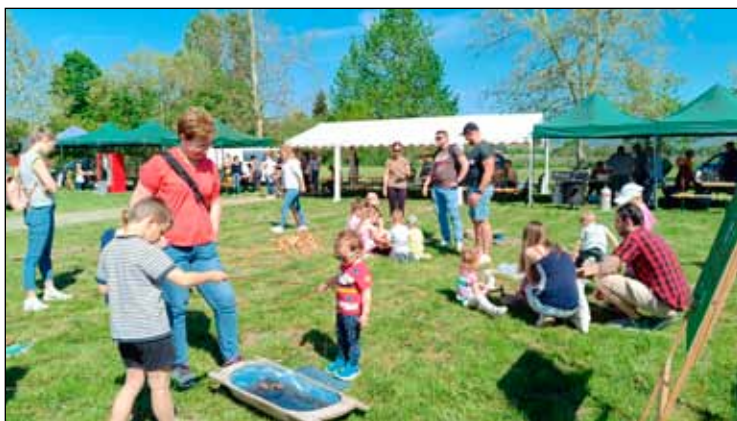
A gyerekeket színes programokkal várták a szervezők