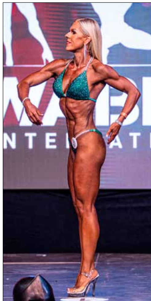
A többéves erősítő edzések eredménye látványos