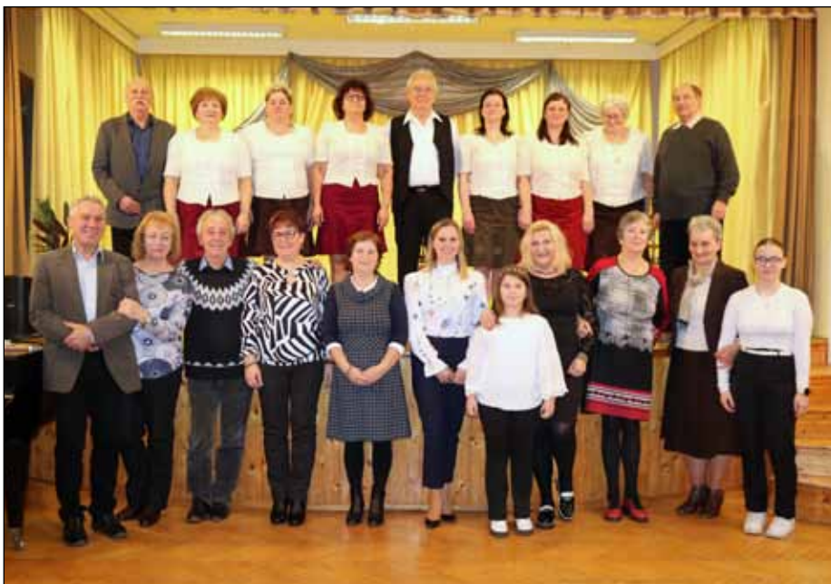
A magyar kultúra napi est szereplői