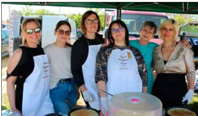
Az óvónők és szülők csapata jótékony céllal főzött