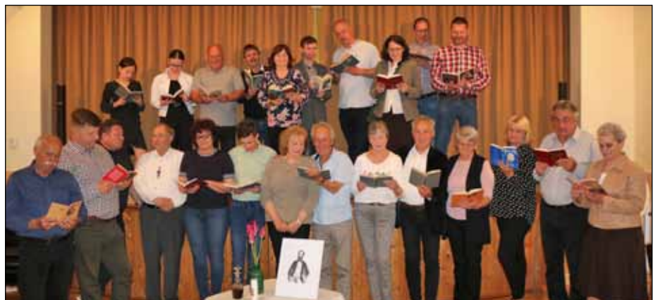
A Jókai est közreműködői – Mert Jókait olvasni jó!