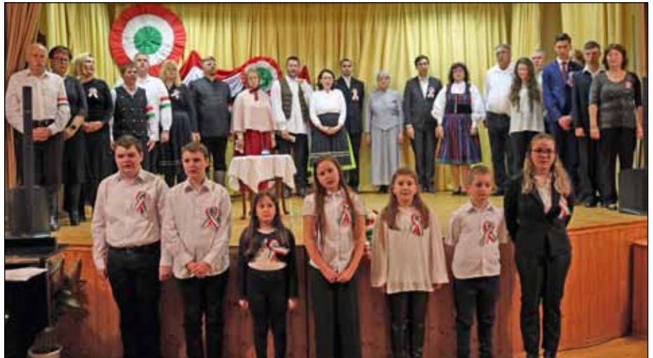
Múltidéző előadásunkkal méltó emléket állítottunk 1848-49 hőseinek

Március 14-én az egész napos szelles, csurgós, csepergős idő is emlékeztetett bennünket a hajdani március 15-re, ami a borongós időjárás ellenére mindmáig nemzetünk legfényesebb napja lett. Délelőtt az iskolások a Községi Házban mutatták be társaik és pedagógusaik, va-