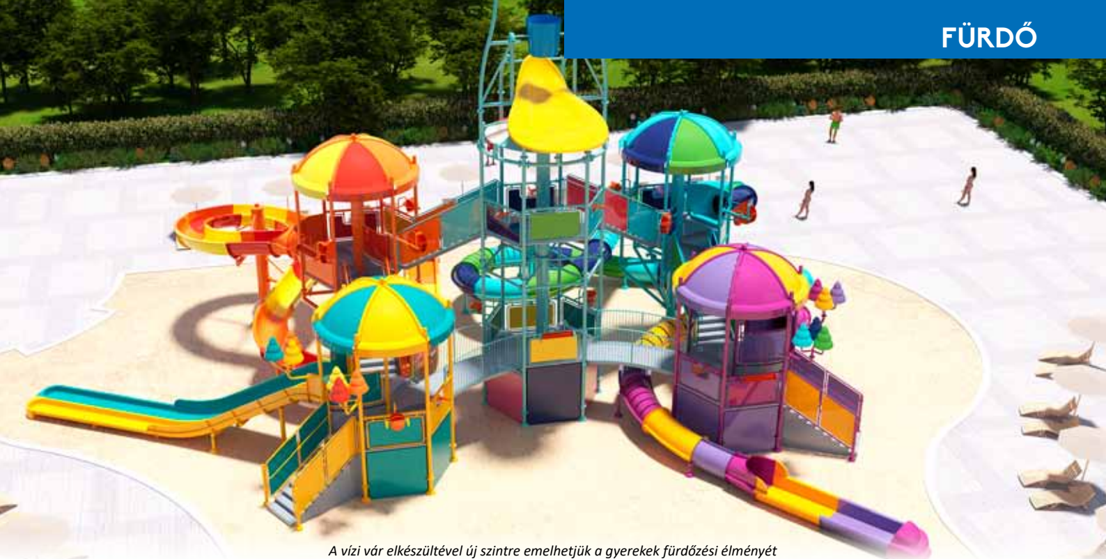
A vízi vár elkészültével új szintre emelhetjük a gyerekek fürdőzési élményét

Ezzel párhuzamosan szálláshelyeinken pedig rendkívül biztatóan alakult a forgalom: az év eddigi részében 17 579 vendégéjszakát regisztráltunk. Ez meghaladja az előző év azonos időszakának 17 301 vendégéjszakáját, amit az építkezések és átalakítások fényében kifejezetten jó eredménynek tartok.