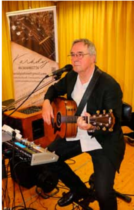
A koncerten a zene és a vers egybeforr