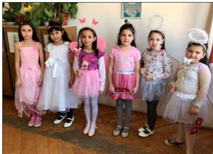
A kislányok angyal és hercegnő jelmezekbe bújtak

Az iskolai ünnepi megemlékezésen a szereplők színes irodalmi műsorban idézték fel a több mint másfél évszázada történt eseményeket. A versekkel, irodalmi szemelvényekkel, dalokkal és tánccal színesített előadás méltó volt nemzeti ünnepünk emelkedettségéhez. Dicséret illeti a szereplő gyerekeket a felkészülés során tanúsított feyelmezzett, lelkiismeretes, kitartó munkájukért.