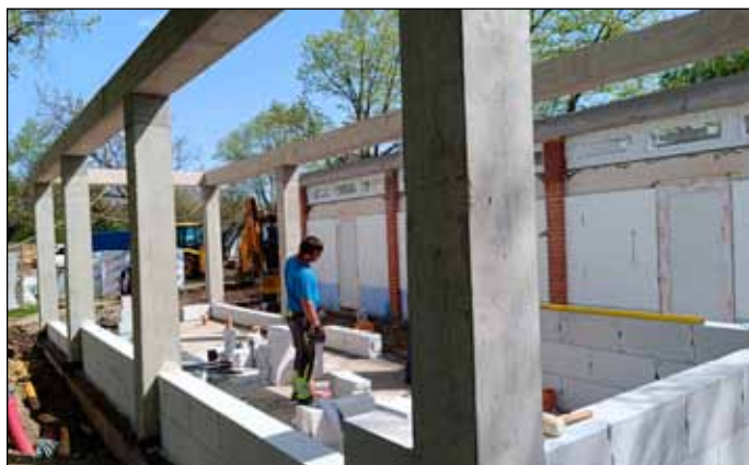
Megújul és bővül az úszómedence melletti vizesblokk