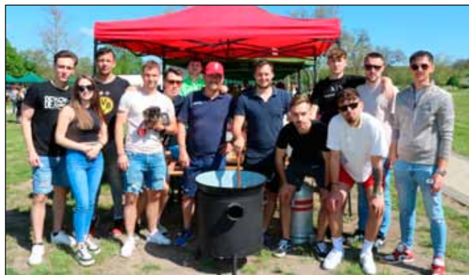
A futballisták a főzésben is összefogtak