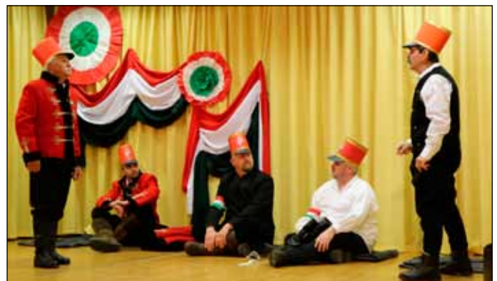
A Bogácsi Társulat egy Krimóczy huszárokról szóló történetet is bemutatott