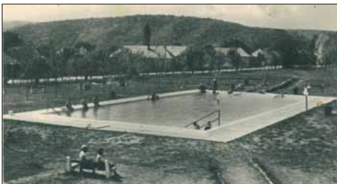
„Egymedencés” fürdők az 1960-as évek elején

(Részlet a Bogács története IV. című könyvből)