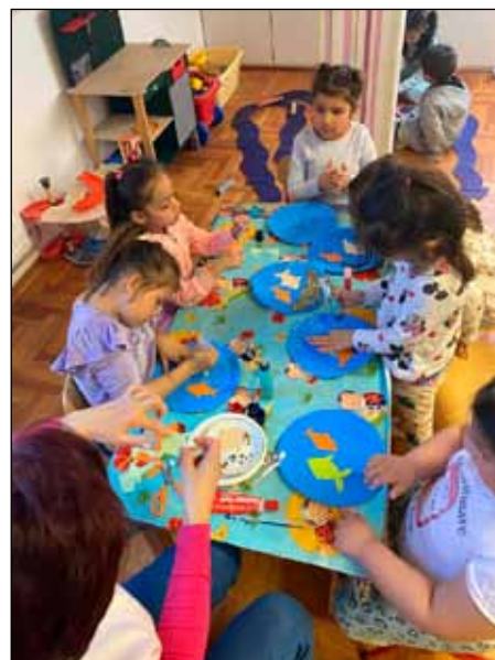
A víz világnapján az ovisok játékosan tanultak életet elemünkről, a vízről