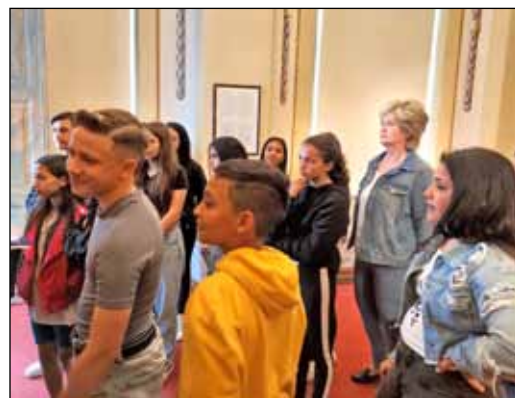
Iskolánk 20 tanulója a Gödöllői Királyi Kastélyban járt