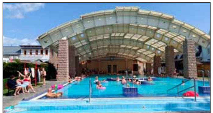
Fürdők első medencéje 2025-ben