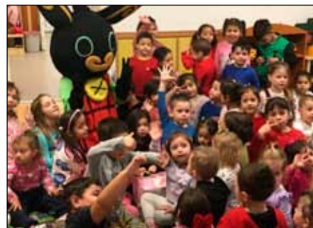
Bing nyuszi rendkívül népszerű volt a kisgyermek körében