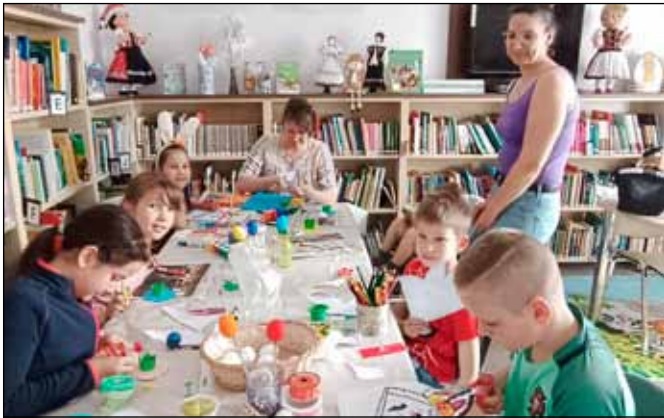
Barátságos légkörben szép alkotások születtek

A tavaszi szünet első napján, nagypéntek előtti csütörtökön a Községi Könyvtárban húsvéti kézműves foglalkozást tartottunk. A gyerekek lelkesen festettek, nyírtak, ragasztottak, mire kis húsvéti asztaldíszük, édességtartó dobozjuk, papírnusziuk készen lett. Az anyukák pedig hungarocell tojást vontak be ruhaanyaggal.