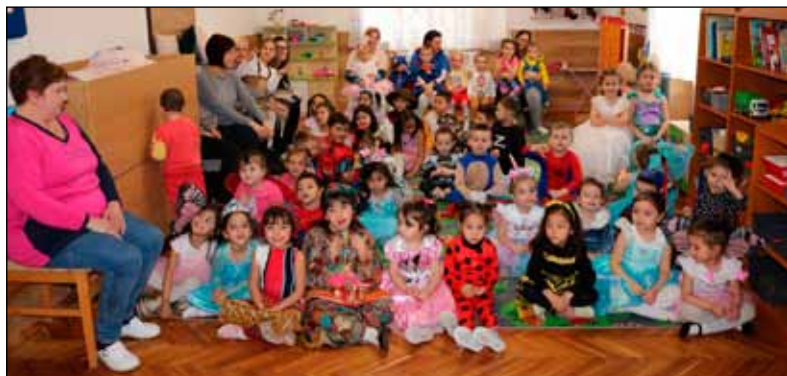
Tarka-barka jelmezekben várták a gyerekek a Pom-pom Família zenekart