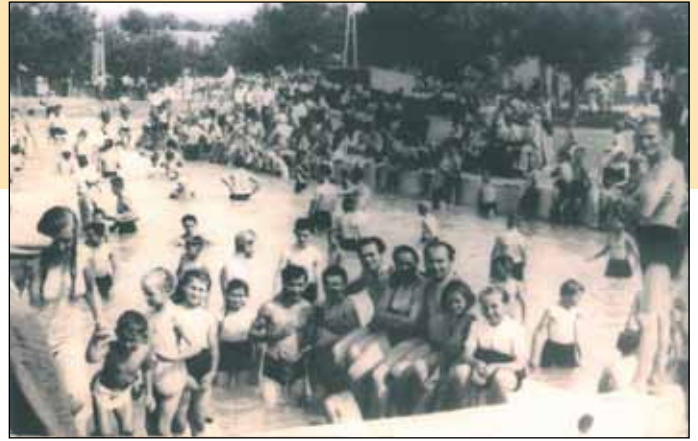
Fürdőzés Bogácson 1959. június 21-én, a fürdő megnyitásakor

Aztán egyik évről a másikra több jelentős beruházás történt. Épült egy kettéosztott felnőtt medence, mellé kör alakú a gyerekeknek, új