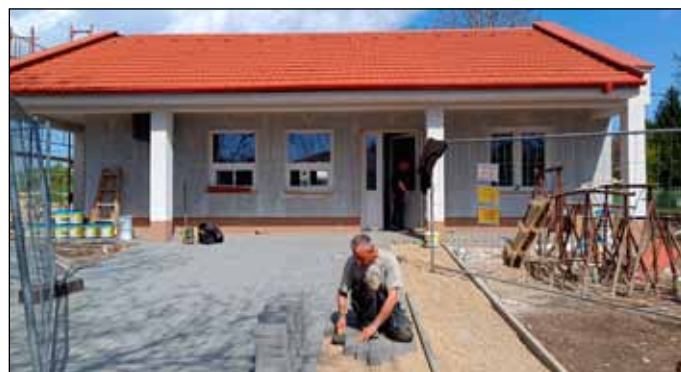
Az új Jurta recepciós épület hamarosan elkészül