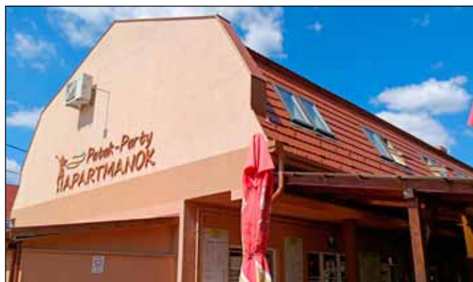
A Patak Party apartmanok kényelmét már élvezhetik a vendégek