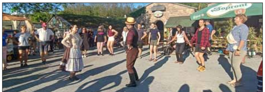
A lengyel turisták a magyar néptánc lépéseivel ismerkedtek