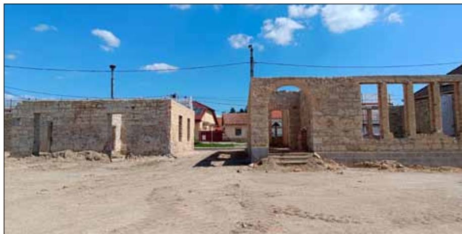
Felújítás alatt a Glóner épülete