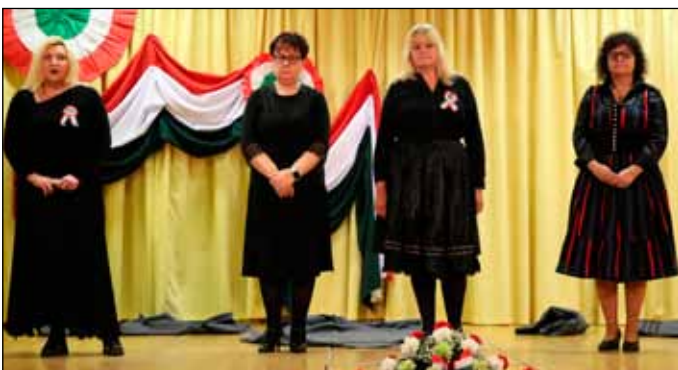
A Társulat szereplői Jókai Mór Csataképek a szabadságharcról című művéből tolmácsoltak gondolatokat