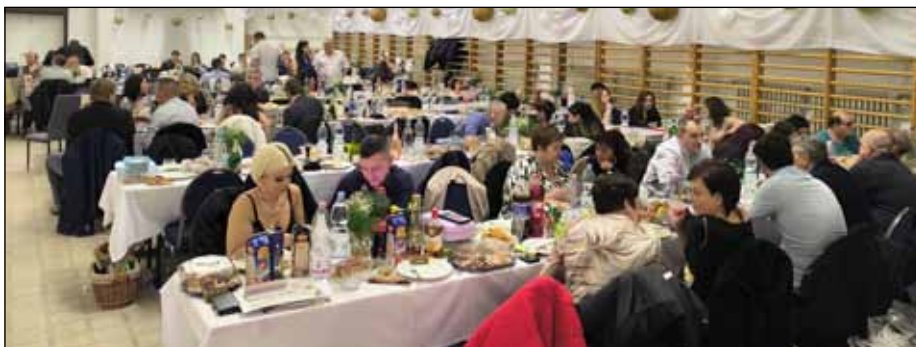
Jótékonyági bál – a nemes cél érdekében ismét sokan fogtak össze