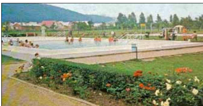
A '70-es évekre elkészült az ikermedence is