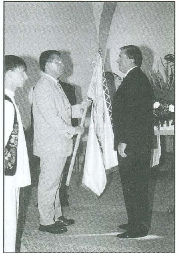
Megkedvelték a lóhere alakú medencét