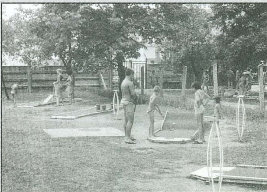
Az idén már minigolf pálya is várta a Strand vendégeit