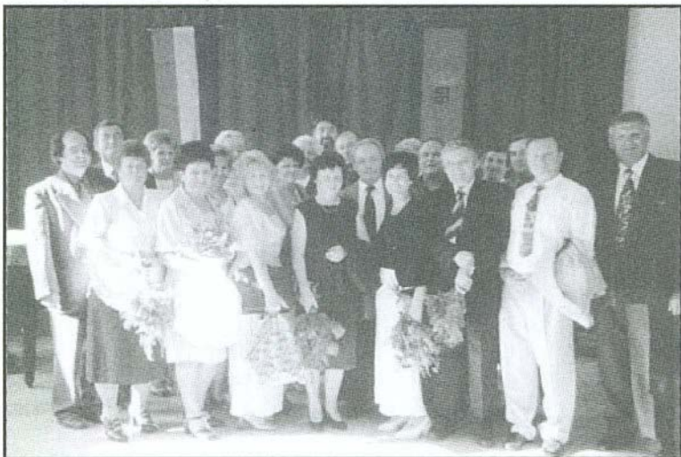
Csoportkép a Művelődési Házban