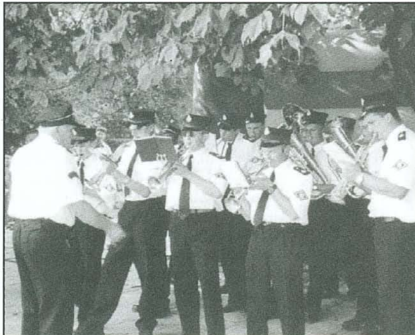
Dr. Matolcsy György gazdasági miniszter adta át a Millenniumi Zászlót