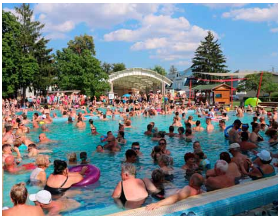
A forró nyári napokon sokan strandolnak Bogácson

Az országos sajtóban megjelenő hírek arról szólnak, hogy egyre több magyar utazik külföldre, az olcsó repülőjegyek elérhetővé tesznek mediterrán országokat is a kisebb pénzü nyaralni vágyók számára. Akik tehát utaznak, azok nagyrésze sem a hazai úticélt választja, hanem a horvát, olasz vagy más tengerparton töltik szabadságát.