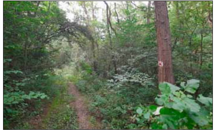
A turistajelzéseket követve eljuthatunk kirándulásunk célállomásához, az útvonalon vagy annak közelében lévő műemlékekhez, barlangokhoz, forrásokhoz, kilátókhoz

Vitathatatlan, hogy Magyarország legszebb turistaösvényei a középhegységekben várják az erdei vándorokat. A hegyvidéki erdőkben egymást érik a természeti látványosságok, barlangok, források, kilátópontok, melyekhez mind-mind külön jelzésű turistaút vezet.