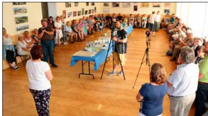
2018-ban a bogácsi Községi Házban fogadtuk a Szomolyáról érkezőket