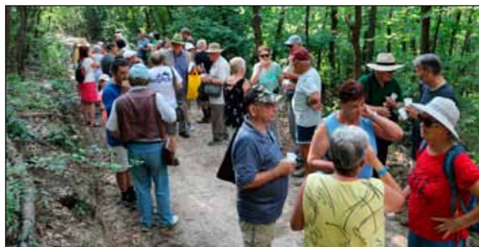
Az emléktúra résztvevői Bogács és Szomolya között félúton találkoznak