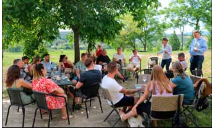
Az AZ Szőlőbirtok és Családi Pincészet tematikus borbemutatójának célja a minőségi borfogyasztás és minőségi borkóstolás népszerűsítése volt

Fél nyolctól esti zenés programok kezdődtek a Rendezvényparkban, Dj Strebinszky alapozta meg a hangulatot, majd este kilenc órától a Wellhello együttes koncertezett volna, ha az időjárás ismét közbe nem szól volna. A koncertet egy óras csúszással, de meg-