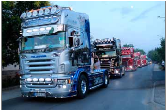
120 kamion vonult át Bogács főutcáján június utolsó napján