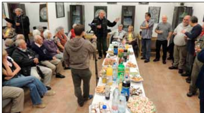
2015-ben Szomolya látta vendégül a túrázókat