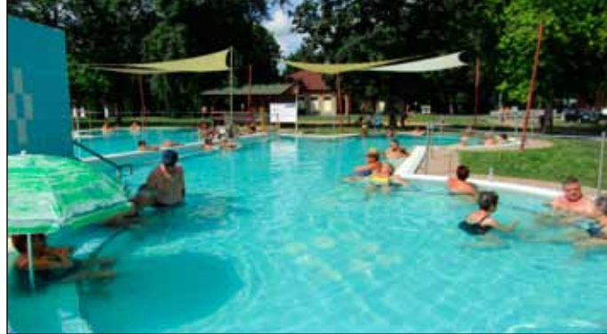
A pillangómedence 35-37° C fokos gyógyvize számos betegségre gyógyír