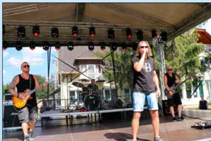
A Miskolc város által Nívódíjjal kitüntetett Biborszél zenekar először lépett fel a bogácsi fürdőben

A Bogácsi Gyógy- és Strandfürdő eddigi nyári eseményei minden korosztály számára szórakoztató és élménydús programokat kínáltak. A látogatók aktívan részt vehettek a sporteseményeken, pihenhettek a gyógyvizes medencékben, vagy élvezhették a strandfürdő nyújtotta kikapcsolódási lehetőségeket.