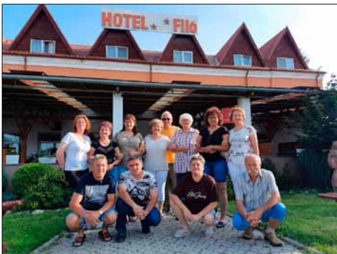
Erdélyi utunk során Csíkszeredán szálltunk meg