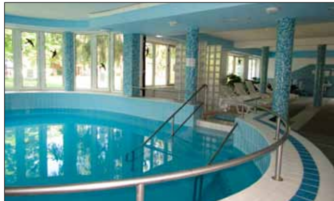
A Gyógycentrum saját belső medencével rendelkezik

Most nézzük át a bogácsi gyógyvíz hatásait. A föld mélyéből feltörő vizek gyógyhatása főként attól függ, hogy milyen kémiai alkotóelemek - kőzetekből kioldott sók, ásványi anyagok, elnyelt gázok - találhatók bennük, és ezek milyen hatással vannak egymásra, valamint az emberi szervezetre. A Bogácson található gyógyvíz ásványi anyag tartalma szerint kalcium-magnézium-hidrogénkarbonátos, fő biológiai hatóanyag alapján pedig a kénes gyógyvizek csoportjába tartozik.