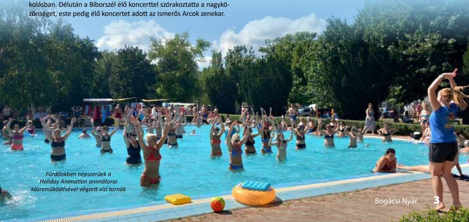
Fürdőnkben népszerűek a Holiday Animation animátorai közreműködésével végzett vízi tornák