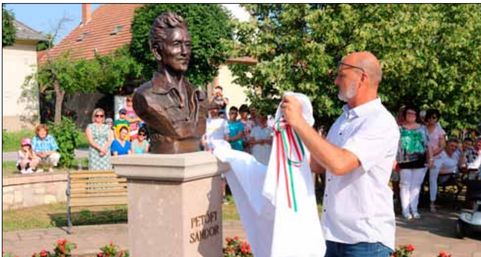
A nagy hőség ellenére sokan jöttek el az első köztéri szobrunk leleplezésére