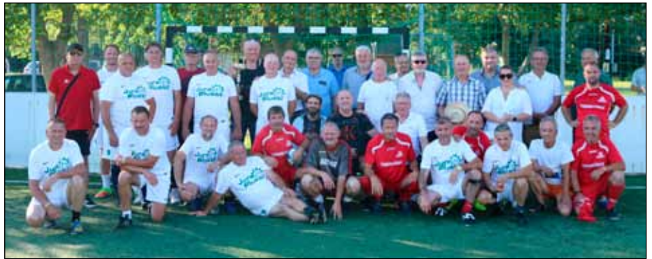
Az idei Szabon György emléktorna résztvevői (piros mezben a csekély számú Bükkalja öregfiúk csapata)

Sokan talán nem tudják, de 1979-től több mint 30 éven át körzeti állatorvos volt Bogács, Cserépfalu és Bükkzsérc településen is, minden háznál ismerték, hiszen min-