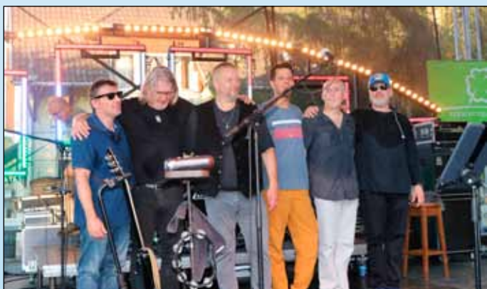
Fürdőzők szárai várták az Ismerős Arcok koncertjét