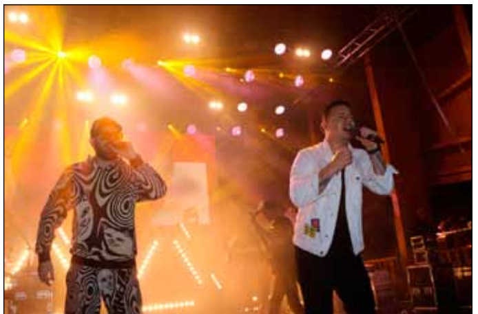
A Wellhello koncertjét megelőző eső csak fokozta a jó hangulatot a Rendezvényparkban

tudtuk tartani, de sajnos töredék közönséggel, mint amire számítottunk. Vasárnap 11 órától a II. János Pál emlékművét koszorúztatta meg Bogács Község Önkormányzata, valamint a Szent Márton Borlovagrend a Szent Márton-műemléktemplomnál, melyet ünnepi szentmise követett.