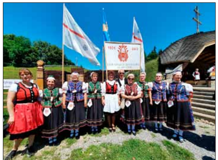
Ezer székely leány napján-Csíksomlyón