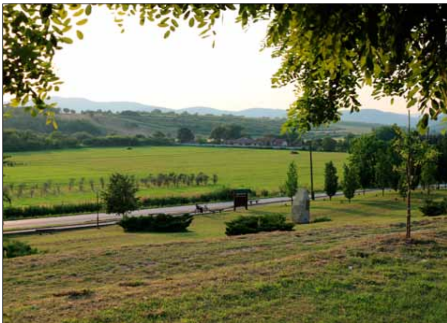
Bogács festői környezete miatt is egyre kedveltebb turisztikai célpont