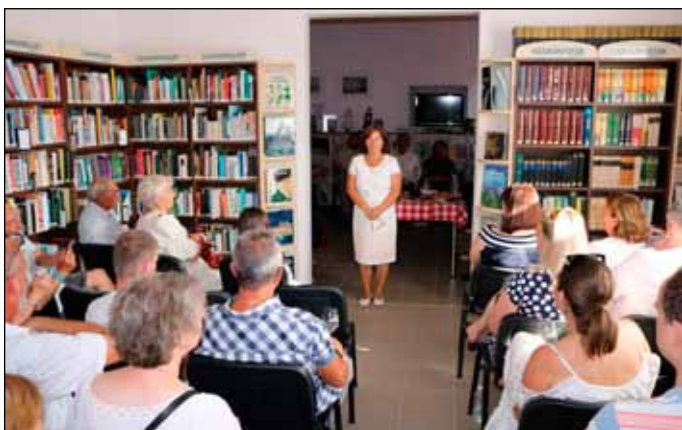
Az emlékévk keretein belül törekedtünk Petőfi életútjának és költészetének bemutatására

Június 22-én, a szoboravatás utáni záró programunknak a Községi Könyvtár adott otthont, a XXIX. Borfesztivál eseményeihez kapcsolódunk Petőfi borversek bemutatásával és borkínálattal.