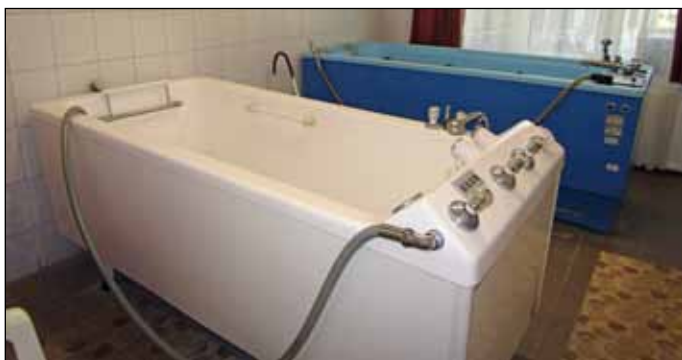
Két „tangentor” kádban gyógyítják a betegeket vízszugár masszázssal

A tényeken alapuló vizsgálatok mellett azonban van egy belülről fakadó bizonyosság már jó régóta mindenkinben, aki a falunkba látogat. Jó itt lenni, mert itt jól ki tudják magukat pihenni az emberek, s fel-frissülve tudnak visszatérni mindennapi életükbe. Ez az a hely, ahová vissza lehet vágnyi, mert ez a bogácsi érzés a jólét érzése.