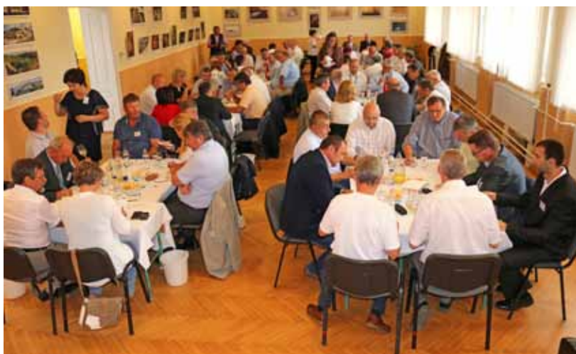
A borbírálat neves borászok és borszakértők részvételével zajlott a Községi Házban