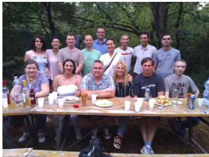
Osztálytársak 20 évvel ezelőtt és most