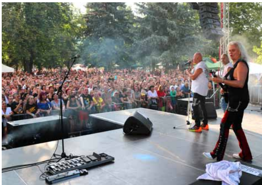
A Sörfesztivál (EDDA koncert) napján csúcsot döntött a fürdő látogatottsága

A másik fejlesztési tervünk, hogy a panzió földszintjén a jelenlegi funkciók (irodák, személyzeti öltözők) helyett szálláshelyet sze-