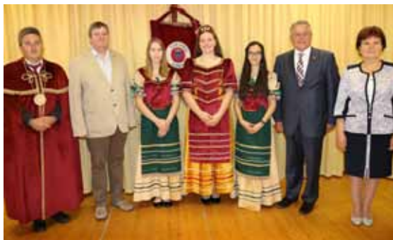
Az ünnepélyes eredményhirdetés résztvevői a XXVI. BÜKKVINVEST-en

2018. június utolsó hetén immár XXVI. alkalommal került megrendezésre Bogácson a BÜKKVINVEST - Bükkaljai Borfesztivál és Nemzetközi Borverseny. A nagy múltú rendezvény hetén természetesen a borverseny állt a középpontban, emellett azonban a szervezők szórakoztató és kulturális programokkal is készültek a vendégek részére. Június 11-15. között a Felvidéken, a Gyöngyösi Hegyközségnél, Tokajban a Monyók Pincészetnél, Miskolc és Környéki Hegyközségnél, valamint Kiskőrös Város Hegyközségénél lehetett leadni a nevezéseket, június 21-én, csütörtök reggel pedig 08:00 órától egészen este 19:00 óráig várta a mintákat a Bükkaljai Hegyközség elnöke és hegybírója a bogácsi Községi Házban. Az idén 239 minta érkezett a Bükki, Egri, Mátrai, Kunsági, Tokaji, Etyek-Budai borvidékről, valamint Szlovákia, Ukrajna, Románia és egy minta Mexikó területéről.