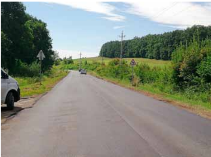
Mindnyájunk örömeire nem kell többé kátyúkat kerülgetni Bogács és Noszvaj között

Régi vágyunk teljesült azzal, hogy az egrí út új burkolatot kapott, megszűntek a kátyúk, a tó melletti szakasz most már nagyon jól járható. A Kossuth és Szomolyai utcák felújítása előkészítés alatt van, terveink szerint 2018. szeptember elején készülhet el. Pályázatot nyújtottunk be a Wass Albert utca burkolatának javítására, mellyel együtt a csapadékvíz elvezetésének problémáját is kezelniük kell, hiszen az itt korábban megépült árok a lezúduló esővíznek csak egy részét vezeti el, jelentős mennyiség folyik az úttesten befelé a fűtárra. S hogy az útfelújításoknál maradjunk, hamarosan megkezdődik a Bogács-Cserépfalu közötti közút burkolatának felújítása, melyre a pályázati fedezet rendelkezésünkre áll. A kerékpárutak közül a Mezőkövesd-Bogács-Cserépfalu-Bükkszerc közötti út engedélyes tervei készen vannak, jelenleg a kisajátítási folyamat zajlik, Bogács vonatkozásában csaknem 400 földtulajdonossal kell egyeztetniük, Cserépfaluban pedig kb. 600 tulajdonos érintett a kisajátításban. Sajnos, míg ennek a folyamatnak a végére nem érünk, addig nem tudjuk az építést megkezdeni. Ennek is megvan a fedezete, valamennyi önkormányzat számláján rajta van a pályázati támogatás. A Miskolcot Egerrel összekötő – szintén Bogácson keresztül haladó – kerékpárút engedélyes tervei készülnek, a megvalósítás költségeit ebben az esetben is pályázati támogatás fedezi.