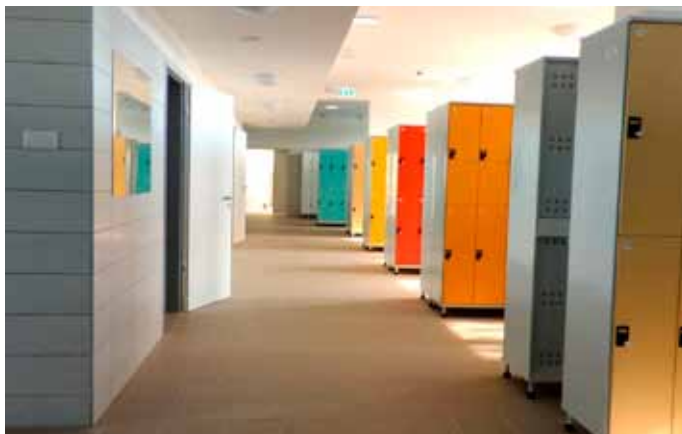
Korszerű szekrényes öltözők szolgálják a fürdővendégek kényelmét