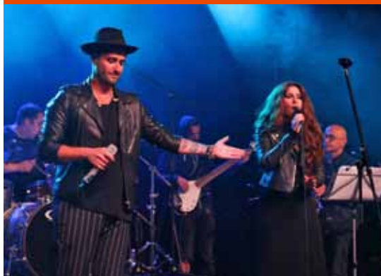
A június végi szokatlan hideg ellenére is sokan voltak kíváncsiak Radics Gigi és Király Viktor koncertjére