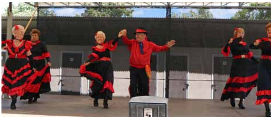
Az életkortól független mozgás örömét sugározták a fellépők