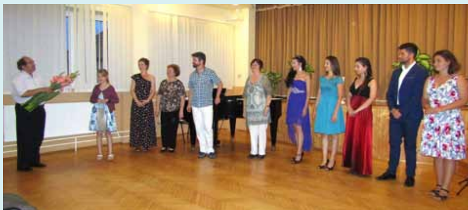
Az énektábor résztvevői minden évben csodálatos koncerttel ajándékozzák meg a közönséget