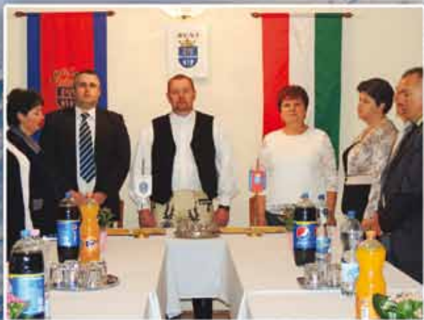
A Hargita megyei Gyergyóújfalu Bogács új testvértelepülése