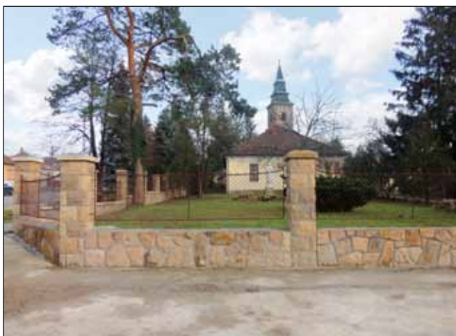
A plébániát körülvevő új kerítés