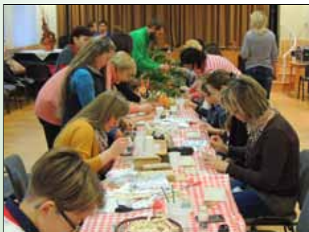
Az adventi játszóházban a felnőttek alkotókedve is megjött

Így éreztük mi is, mikor évekkkel ezelőtt belesöpöpentünk egy olyan csoportba, ahol minden egyes eltöltött perc sugallta, hogy idegenként is a közösség részei vagyunk. A Hagyományok Háza TÁ-BOR nyári kurzusa testi-lelki feltöltődést adott nekünk, az egész napos játékkal, alkotással, énekléssel, az esti közös táncsal, beszélgetéssel. A táborban elvársolt minket a szövőszekek zaja, a kusza fonalakból készült nemezlabdák tarkasága, és a vékonyka fűzfavessző hajlékonysága, melyből