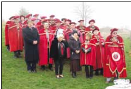
Az új és a régi borlovagok