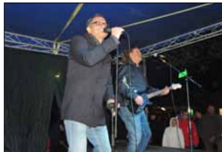
A Bon-Bon együttes fellépésére a hideg ellenére sokan vártak