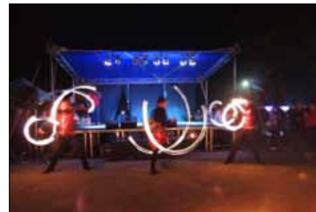
Tűztánc-show a pincesoron