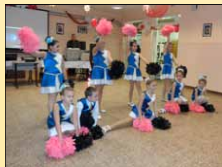
A Bogácsi Liliom Mazsorett Csoport műsorát nagy taps kísértc