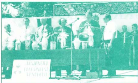
Díjkiosztás a fürdő szabadtéri színpadán