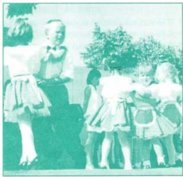
Ők még tejet isznak, de a vidámságot, a táncot már ebben a korban is szeretik