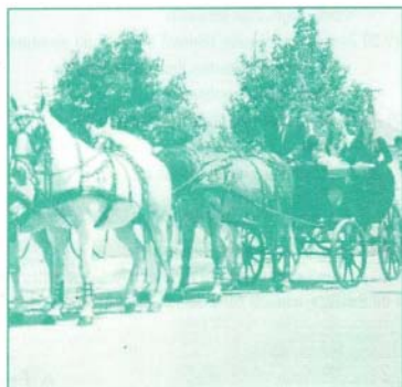
Hintó vitte végig a falun a borkirálynőt és udvarhölgyeit