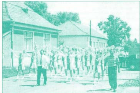
Lengyel mazsorettek felvonulása a tavaszi fesztiválon