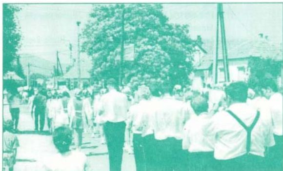
A fesztivál minden évben legrangosabb eseménye Bogácsnak