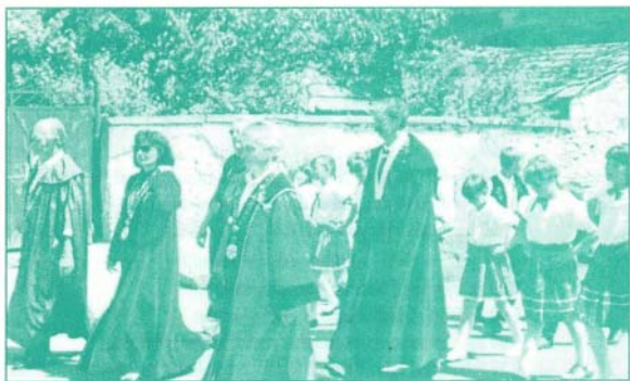
Rendezvényünket megíti borlovagrendek képviselői is